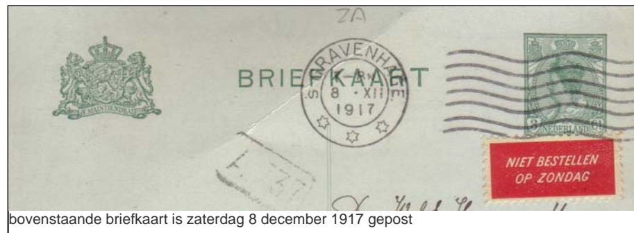
bovenstaande briefkaart is zaterdag 8 december 1917 gepost

Door dit etiket op het poststuk te plakken kon de afzender aangeven dat de verzending niet spoedeisend was, zodat de bezorging tot maandag kon worden uitgesteld.