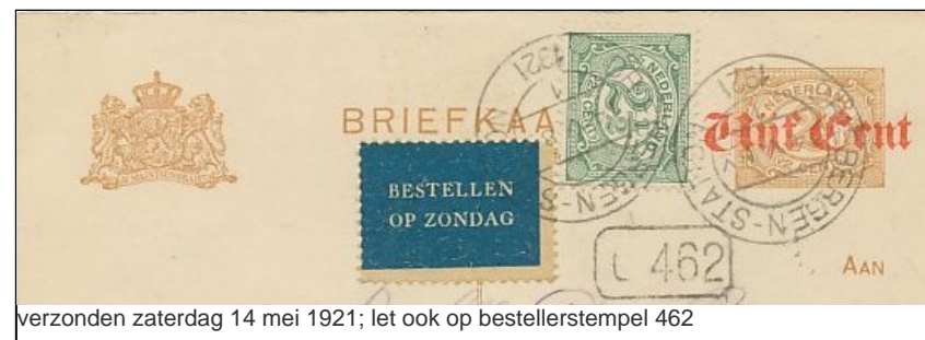
verzonden zaterdag 14 mei 1921; let ook op bestellerstempel 462