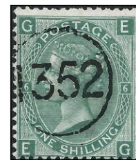
Postaal stempel Telegrafisch

Vooraf de 1s. groen van de platen 5 en 6, zijn geen extra toeslag waard ten opzichte van de catalogusprijs, terwijl anderen, als de 2 ½ d. rooskleurige mauve of 9d. een