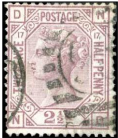
2 ½ d. gebruikt Groot Brittannië

Er is wel eens opgemerkt dat een aantal vlakdruk uitgiften (steendruk, lithografie) van 1855-1887 hoger geprijsd zijn in de catalogus onder Groot-Brittannië dan bij sommige 'in het buitenland gebruikt' onderdelen. Een 1873-80 2 ½ d. rooskleurige mauve (SG 141) bijvoorbeeld, kost € 50 in de GB notering, maar 27 pond gebruikt in Suez, £ 24 in Constantinopel, £ 21 in Gibraltar en slechts £ 17 gebruikt in Malta. Dit is niet omdat er minder interesse in GB 'gebruikt in buitenland' maar omdat de prijzen gerelateerd zijn aan 'conditie goed' voor de betreffende uitgifte'.