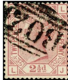
Suez 'B02' stempel

GB postzegels die in Malta gebruikt zijn bijvoorbeeld, zijn over het algemeen vrij zwaar afgestempeld met het stempel 'A25' en de genoteerde prijs is voor een postzegel met deze afstempeling terwijl de prijs voor de in GB gebruikte versie voor een aanzienlijk beter afgestempelde postzegel is.