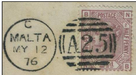
Malta 'A25' afstempeling