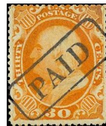
Achtereen volgens valse stempels op zegels van Nova Scotia, Sierra Leone, St. Kitts en USA.

Het resultaat is dat we ons allemaal bewust moeten zijn van postzegels die op het eerste gezicht gebruikte exemplaren lijken te zijn, maar waarbij het stempel niet kan worden geïdentificeerd middels een plaatsnaam of datum.