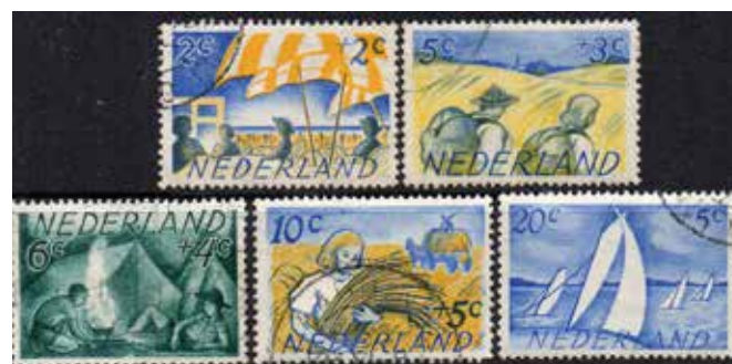
voor k 104, zie volgende bladzijde