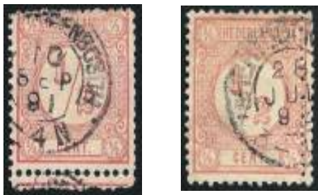
Twee postzegels met de fijnere Bossche tanding 14. • De linker zegel: boven. • De rechter zegel: rechts opzij.

In andere steden hanteerde men wel hetzelfde procédé (b.v. de 'Gendringse' of 'Amsterdamse' tanding). Ook knipte men wel met een schaar de strookjes uit de vellen. Als daarbij zegels werden geraakt, resulteerde dat in bv. de 'Heerlense knip'. Het bekendst is echter de 'Bossche tanding'. Dat komt omdat dit systeem van het perforeren van adresstrookjes in 's-Hertogenbosch erg lang is toegepast: van 1877 tot wel in 1920. Nog meer omdat over de 'Bossche tanding' uitzonderlijk veel is gepubliceerd, met name door twee roemruchte leden van de Bossche vereniging, wijlen Jos van Roosmalen en Jan Cleij.