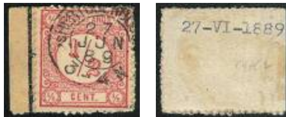
Voor- en achterzijde van een gedeelte van een adresstrookje met de Bossche tanding. Aan de achterzijde (rechts) is duidelijk de perforatie boven, onder en opzij te zien.

Het is de Engelsman J.A. Leon die de eer ten deel valt het raadsel op vernuftige wijze te hebben opgelost. In een artikel in de Philatelic Journal of Great Britain verleende hij in 1911 de zegel met Bossche tanding de status waarop deze recht had.