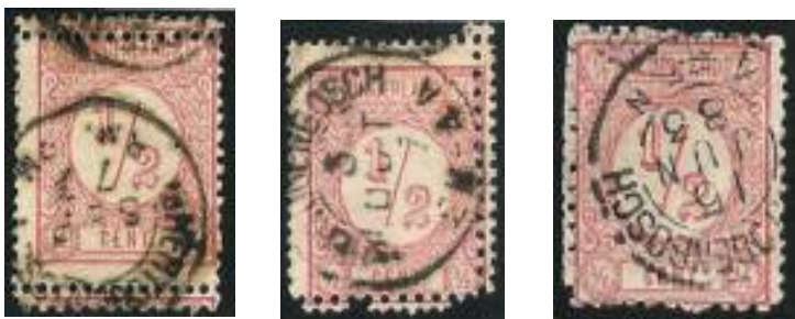
Drie postzegels met Bossche tanding 12. De linker zegel: boven en onder. Midden: rechts en onder. De rechter zegel: aan drie zijden

exemplaren. Maar ook de 2 en de 2½ cent met Bossche tanding komen sporadisch voor en zijn dus zeer kostbaar.