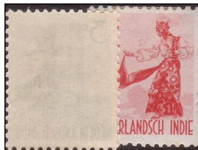
Ned. Indië NVPH 298 (1941), postfris