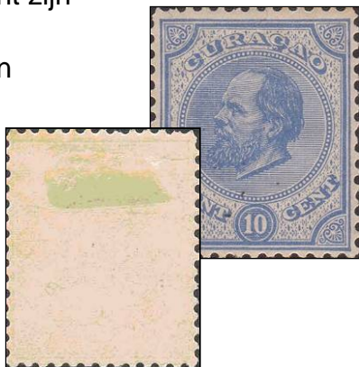
Curaçao NVPH 4 (1873), nette plakker