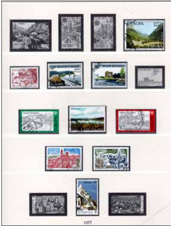
uit kavel 118 1